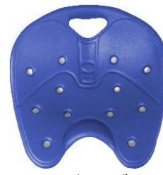
エーゲアンブルー