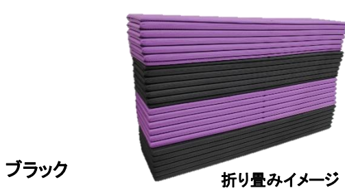
折り畳みイメージ