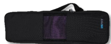
別売:フォールディングヨガマット用特製ケース 1,800円(税抜)

フォールディングヨガマットは折り畳み式で、準備や収納も簡単。長尺が182センチと長身の方でも余裕で使える長さなのに重さが超軽量、約980グラム！折り畳み方次第で22通り以上の使い方ができ、優れたクッション性と高いグリップ力により、ヨガだけでなくピラティスや筋トレ、アウトドアでも大活躍します。また、素材本来の特質で、床から来る痛みを軽減し、洗えて無臭、傷つきにくい等15の特長があります。